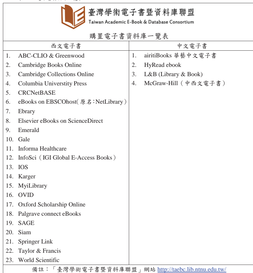
表一：電子書資料庫一覽表